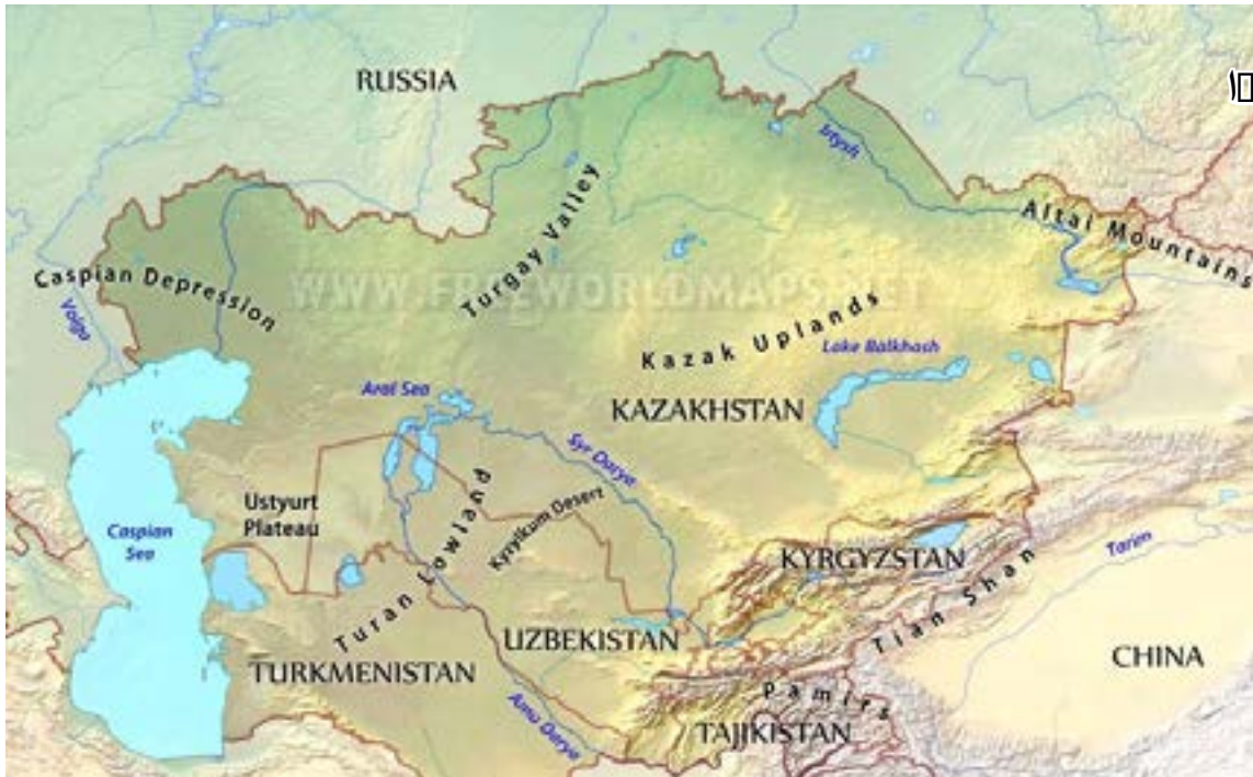
خريطة 1 تظهر الامتداد الجغرافي لآسيا الوسطى

فعلى المستوى الآسيوي، تشكّل آسيا الوسطى نقطة وصل بين الأطراف الآسيوية، كما إن لها حدودًا مع جميع القوى المؤثرة والإقليمية كونها على تماس مباشر مع روسيا والصين وإيران وتركيا، وتطلّ على شبه القارة الهندية، وهذا ما يفسّر حجم الإستقطاب الخارجي الذي تعرّضت له المنطقة تاريخيًا.